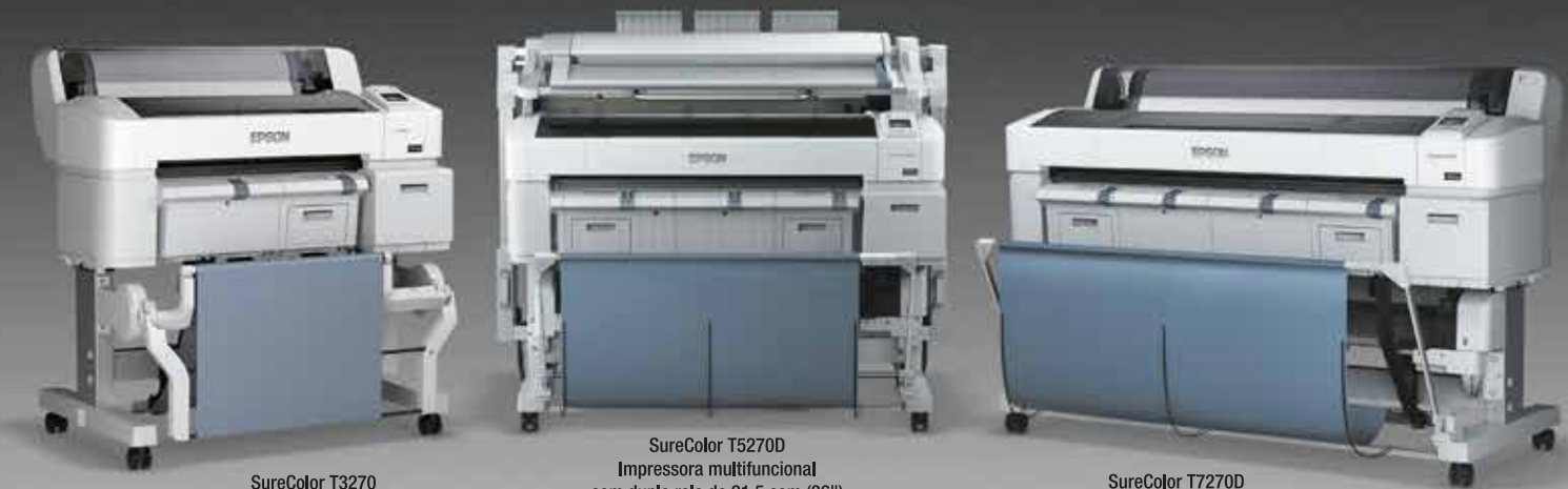
SureColor T3270 Impressora com rolo simples de 61 cm (24")