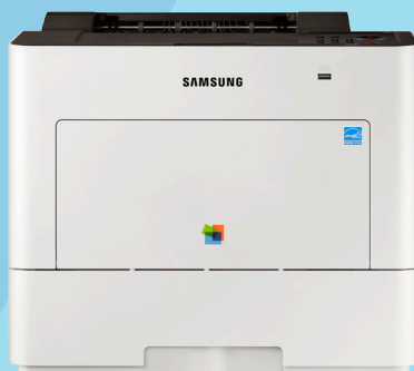
C4010ND (40 ppm)